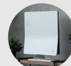
(別売)専用スタンド

商品ご理解のために ●本カタログに掲載の商品は日本国内仕様です。海外では使用できません。