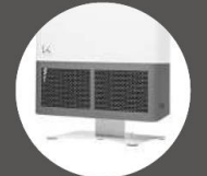
(別売)専用スタンド

商品ご理解のために ●本カタログに掲載の商品は日本国内仕様です。海外では使用できません。 電気代について ●新電力料金目安単価は1kWhあたり27円(税込)で算出しています。●使用する時期、部屋などの諸条件による変動があります。 商品のご使用について ●医療用器具ではありません。●石油・ガス器具など燃焼に伴う一酸化炭素などは除去できませんので石油暖房機などのご使用時は換気が必要です。